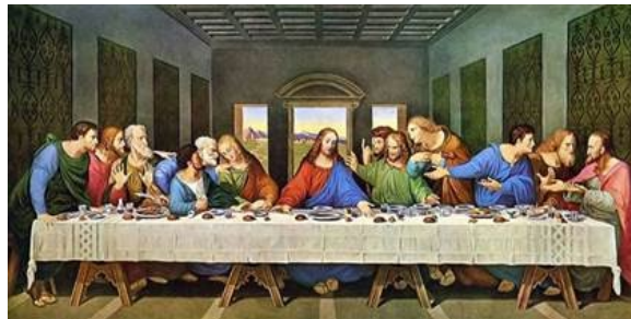
La Cène, Léonard de Vinci

Jésus les appelle au début de sa vie publique. Ils resteront auprès de lui jusqu'au dernier repas.